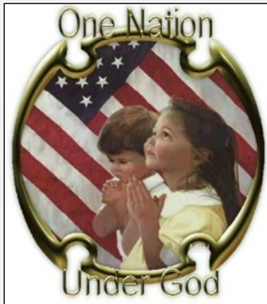
Uttrykket "One nation, under God" brukes flittig av amerikanske kristne for å gi inntrykk av at USA er et kristent land.

American Humanist Association (AHA) er skuffet over kjennelsen, og påpeker at ordene "under God" ble innført i troskapseden først i 1954. Opprinnelig var eden religionsnøytral.