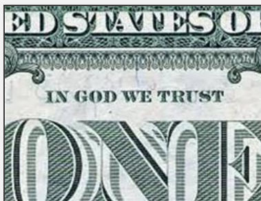
Mottoet "In God we trust" som står på alle sedler og mynter i USA, har også blitt hevdet å være i strid med grunnloven. Høyesterett har avvist dette. Mottoet ble offisielt innført i 1956, to år etter at man la til "under God" i troskapseden.